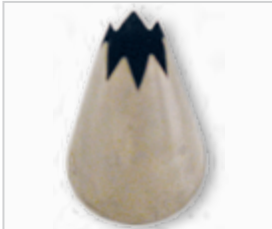
Spuitmond kartel .....