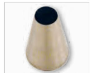
Spuitmond glad .....