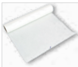
Vetvrij papier .....