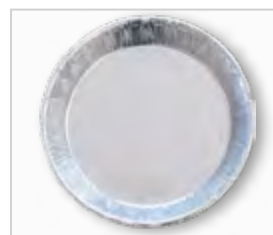
Aluminium schaalte .....