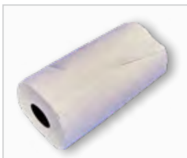
Papierrol, pluisvrij .....