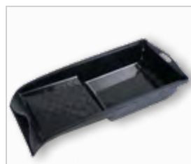
Verfbak, plat .....