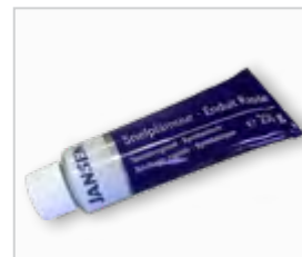
Acrylplamuur, tube .....