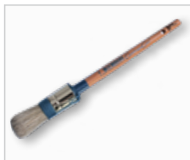
Acrylkwast, rond .....