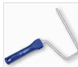
Beugel voor de verfroller .....