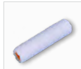
Verfroller voor acrylverf .....