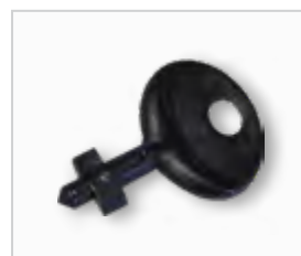
Sleutel bijvulartikelen .....