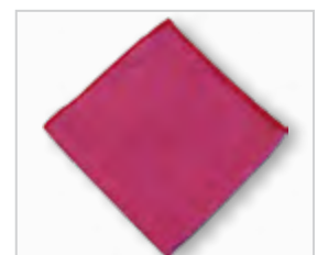
Microvezelwerkdoek, rood .....