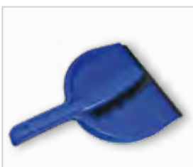
Stoffer en blik .....