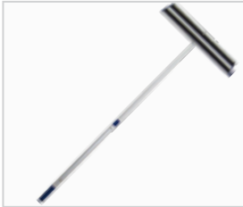
Steel met frame .....