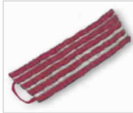
Microvezelmop, rood .....