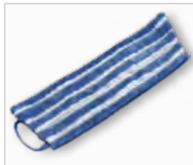
Microvezelmop, blauw .....