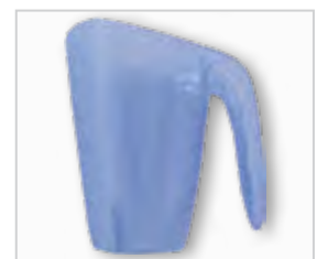
Doseerschep voor wasmiddel .....