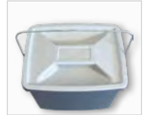
Bewaarbox voor microvezelwerkdoeken .....