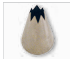
Spuitmond kartel .....