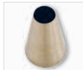
Spuitmond glad .....